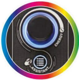
IMA INTELLIGENT MUSIC ASSISTANT