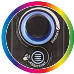
IMA INTELLIGENT MUSIC ASSISTANT