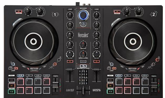
DJCONTROL IMPULSE 300